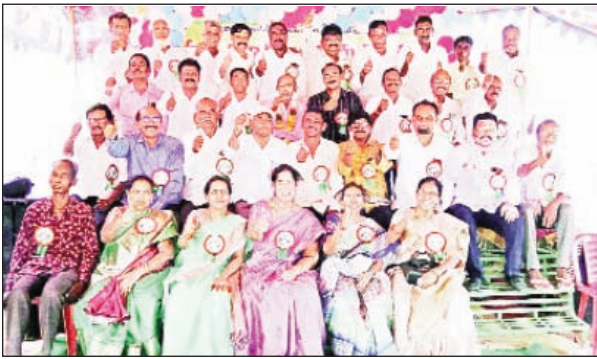
హుజూర్ నగర్ రూరల్, మే 04, ప్రభాతవార్త: హుజూర్ నగర్ మండలం