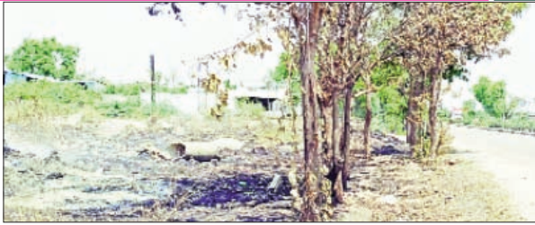
సంబంధిత అధికారులు, చెట్లను అగ్గిపాలు చేసిన ఇండస్ట్రీ యాజమాన్యం పై చర్యలు తీసుకోవాలని గ్రామస్థులు కోరారు.

ప్రభుత్వం ప్రతిష్ఠాత్మకంగా తీసుకొని, మహాత్మా గాంధీ జాతీయ ఉపాధిహామీ పథకం కింద పచ్చని చెట్లని పెంచాలని, ప్రకృతిని పర్యావరణాన్ని కాపాడే క్రమంలో, మొక్కలను పెంచాలనే దృఢ నిశ్చయంతో ప్రభుత్వాలు, అధికారులు పనిచేస్తుంటే, ఆశ్రద్ధతో, నిర్లక్ష్యంగా, మండలంలోని కుక్కడం సమీపంలోని, వాసవి సాల్వేట్ ఇండస్ట్రీ యాజమాన్యం, హరిత హారం చెట్లను అగ్గిపాలు చేస్తున్నా, అధికారులు తమకేమీ పట్టనట్లు, అటువైపు చూడక పోవడం విద్వేషమని, ఇకనైనా